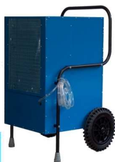
DESU 170 : face arrière